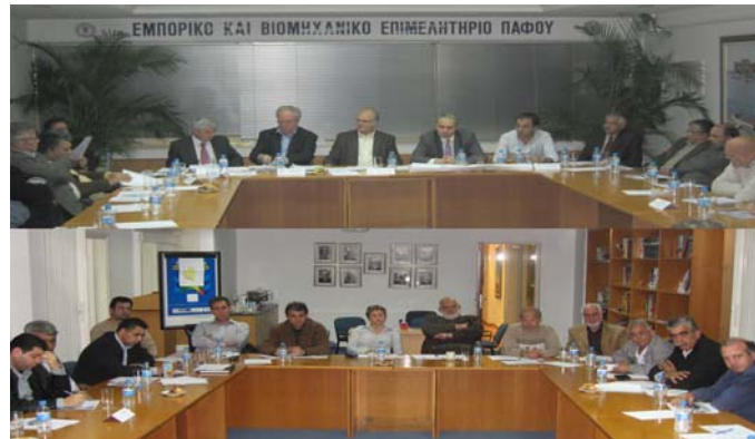
Από την σύσκεψη του Βιομηχανικού Τμήματος