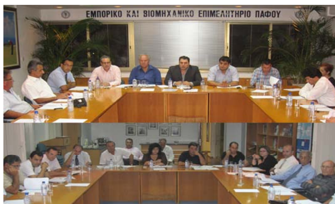
Από την σύσκεψη του Τουριστικού Τμήματος

Στο Συμβούλιο συμμετέχουν εκπρόσωποι όλων των επαγγελματικών και οικονομικών δραστηριοτήτων του τουριστικού τομέα και προωθεί την επίλυση προβλημάτων που επηρεάζουν την τουριστική ανάπτυξη και την βιωσιμότητα των τουριστικών επιχειρήσεων σε συνεργασία με τους άλλους θεσμοθετημένους φορείς του τουρισμού.