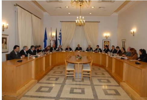
Από την σύσκεψη της Εκτελεστικής Γραμματείας της ΣΕΚΟ με τον Πρόεδρο της Κυπριακής Δημοκρατίας κ. Δ. Χριστόφια