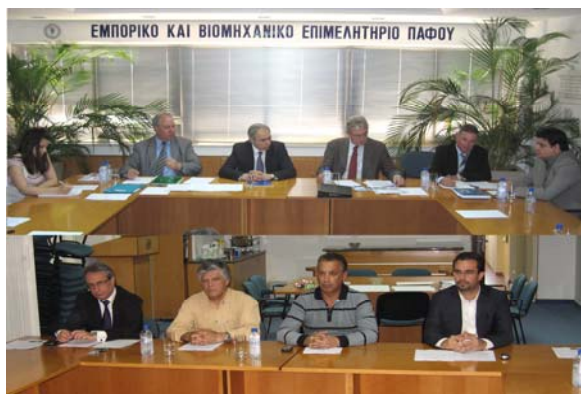
Από την συνάντηση με τον Πρέσβη της Γερμανίας