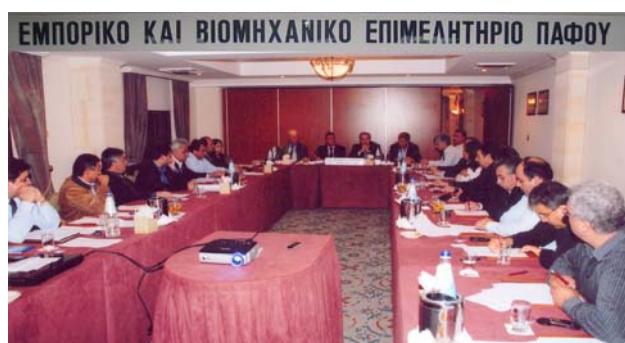
Απο την συνεδρία του Συμβουλίου Υπηρεσιών