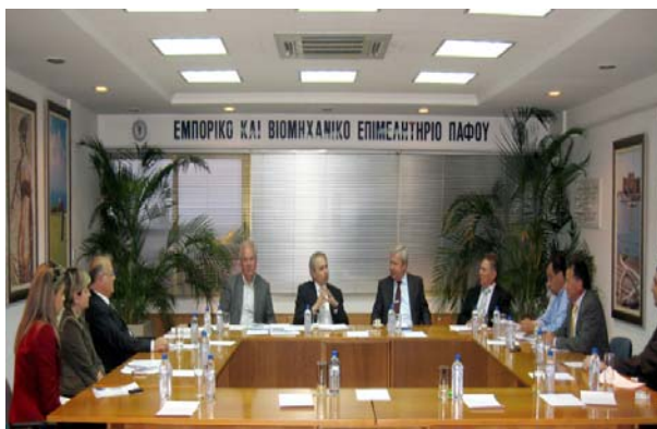
Από την συνάντηση με τον Πρέσβη της Ρωσίας