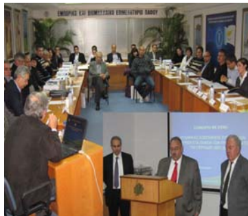
Από το σεμινάριο σε συνεργασία με το Γραφείο Προγραμματισμού