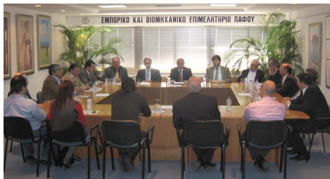
Από την εκδήλωση με την Υπηρεσία Ενέργειας στην παρουσία του Υπουργού Εμπορίου, Βιομηχανίας και Τουρισμού κ. Α. Πασχαλίδη

Το Επιμελητήριο ευχαριστεί θερμά τον Υπουργό Εμπορίου, Βιομηχανίας και Τουρισμού κ. Α. Πασχαλίδη και τον Διευθυντή της Υπηρεσίας Ενέργειας κ. Σ. Κασίνη για το ενδιαφέρον τους για την Πάφο και την στενή τους συνεργασία με το Επιμελητήριο.