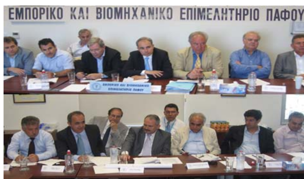
Από την σύσκεψη με τον Υπουργό Συγκοινωνιών και Έργων κ. Ν. Νικολαΐδη

Ιδιαίτερες ευχαριστίες πρέπει να αποδοθούν στον πρώην Υπουργό Συγκοινωνιών και Έργων κ. Νικολαΐδη για την σημαντική συμβολή του στη ανάπτυξη του Αεροδρομίου Πάφου και τις πρωτοβουλίες και προσπάθειες του που στοχεύουν στη μεγαλύτερη δυνατή απόδοση των διαφόρων έργων υποδομής και ανάπτυξης.