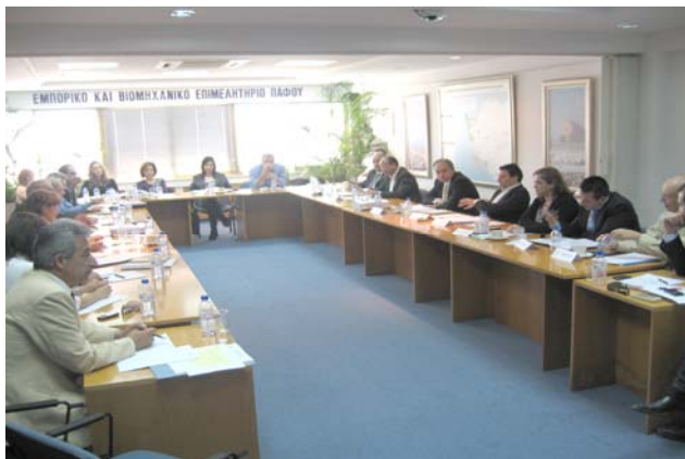
Από την σύσκεψη με τον ΚΟΤ και άλλους συνδέσμους / φορείς της Πάφου