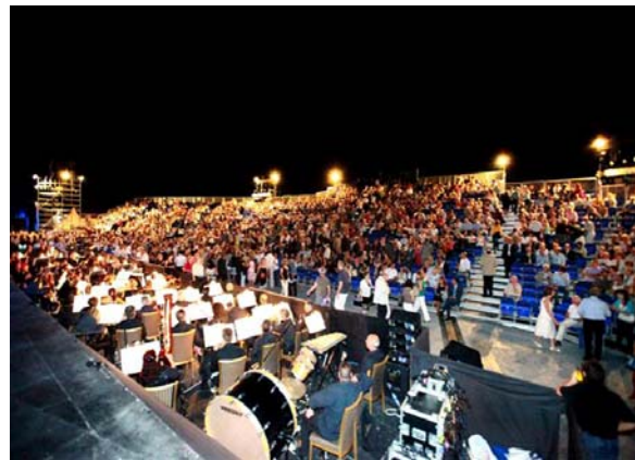
Από την Όπερα 2009 του Leo Delibes “ΛΑΚΜΕ”