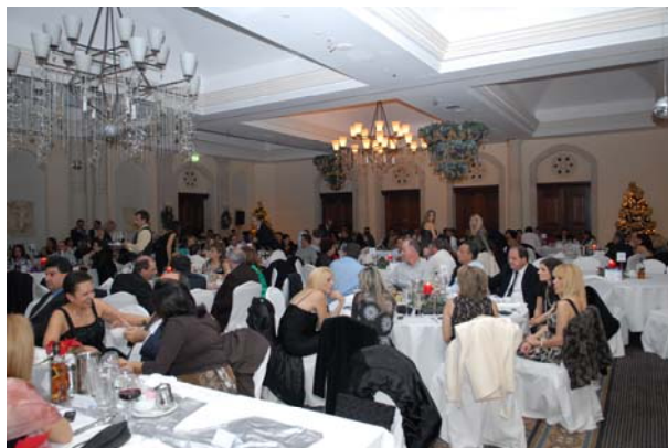
Από τον Ετήσιο Χορό του ΕΒΕ