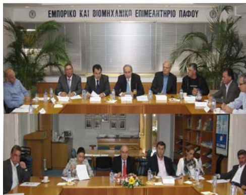
Από την συνάντηση με τον Πρόεδρο της ΕΔΕΚ κ. Γ. Ομήρου