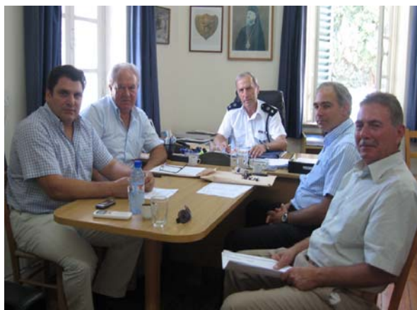
Από την επίσκεψη στο Αστυνομικό Διευθυντή Πάφου

Η υλοποίηση της Β΄ φάσης δυστυχώς καθυστερεί λόγω της οικονομικής κρίσης. Η απόφαση αυτή είναι σε αντίθεση με της υποσχέσεις του Κράτους και της διακηρύξεις του αρμόδιου Υπουργείου και πλήττει καίρια τόσο την απόδοση του Αστυνομικού Σώματος όσο και την εξυπηρέτηση των πολιτών της Επαρχίας της. Ταυτόχρονα η εξέλιξη αυτή βραχυκυκλώνει τις προσπάθειες του Δήμου Πάφου για εξωραϊσμό και αναβάθμιση του εξαιρετου αυτού οικοδομήματος και την αξιοποίηση του για χρήσεις συμβατές με τον χαρακτήρα και το περιβάλλον της περιοχής.