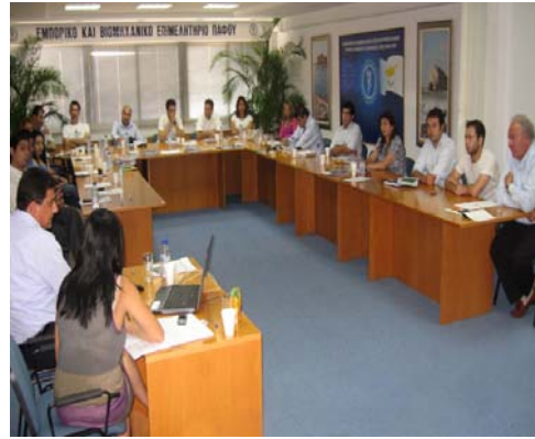
Από το σεμινάριο σε συνεργασία με το Ίδρυμα Προώθησης Έρευνας