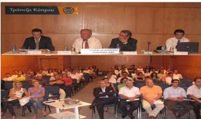
Από την ενημερωτική διάλεξη για τις διαδικασίες και τους τρόπους πρόσβασης και αξιοποίησης του ΚΑΠ

Ενώ άρχισε η λειτουργία της Υπηρεσίας μέσω της οποίας οι επιχειρηματίες θα έχουν πρόσβαση στο ΚΑΠ της Κεντρικής Τράπεζας, δεν αξιοποιήθηκε όσο θα έπρεπε από τον επιχειρηματικό κόσμο.