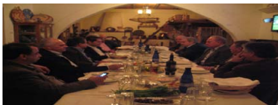
Από το γεύμα εργασίας με το Δ.Σ. της Αρχής Κρατικής Έκθεσης Κύπρου

για την συμμετοχή περισσότερων επιχειρηματιών της Πάφου στις εκθέσεις που διοργανώνει η Αρχή Κρατικών Εκθέσεων. Παράλληλα συμφωνήθηκε η συνδιοργάνωση και στη Πάφο τοπικών εκθέσεων.