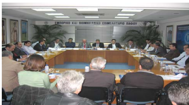
Από την σύσκεψη του Τμήματος Υπηρεσιών

Το Συμβούλιο, στο οποίο συμμετέχουν εκπρόσωποι όλων των επαγγελματικών και οικονομικών δραστηριοτήτων του τομέα υπηρεσιών, προωθεί την επίλυση προβλημάτων που επηρεάζουν την ανάπτυξη και την βιωσιμότητα των επιχειρήσεων του τομέα σε συνεργασία με άλλους θεσμοθετημένους φορείς του κλάδου .