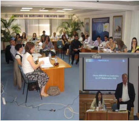
Από το σεμινάριο σε συνεργασία με την Υπηρεσία ΦΠΑ και το Τμήμα Εσωτερικών Προσόδων