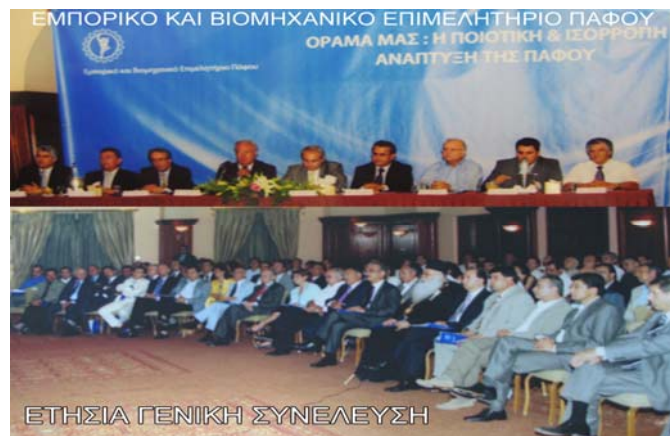
Από την περσινή Ετήσια Γενική Συνέλευση του Ε.Β.Ε. Πάφου